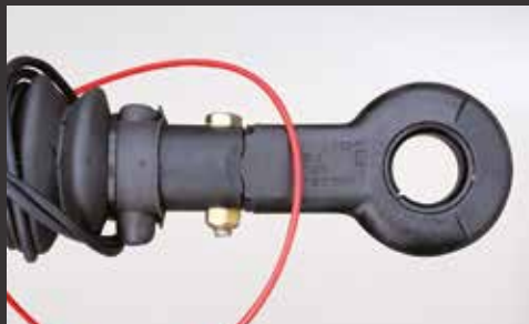
DIN-Zugöse für höhenverstellbare Deichsel