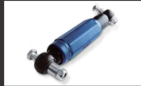
Radstoßdämpfer (lose) ohne 100 km/h Bestätigung