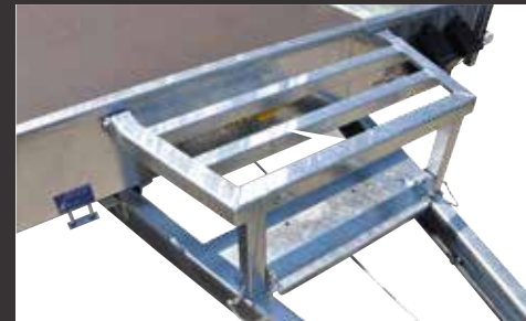
Baggerschaufelablage klappbar für V-Deichsel