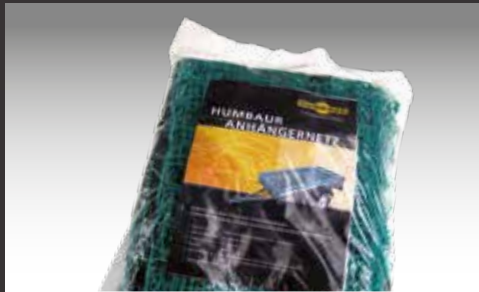
Abdecknetz in verschiedenen Größen