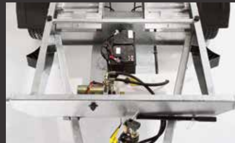
Kombibetrieb aus Hand- und Elektropumpe