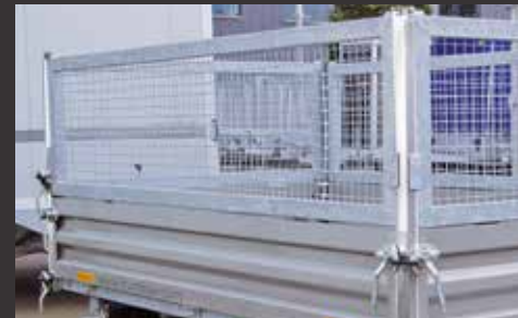
Stahlgitteraufsatz 620 mm