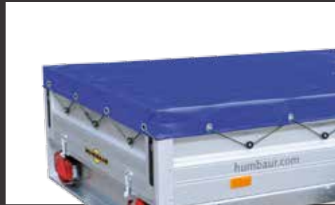
Flachplane in verschiedenen Farben und Größen