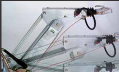
Höhenverstellbare Zugdeichsel (Kugelkopf-Kupplung und DIN-Zugöse nicht inklusive)