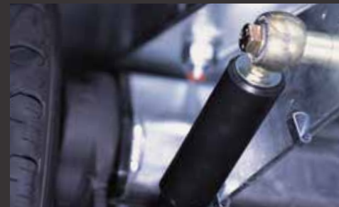
Radstoßdämpfer (montiert) inkl. 100 km/h Bestätigung