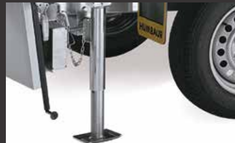
Teleskopkurbelstützen (2 Stück)