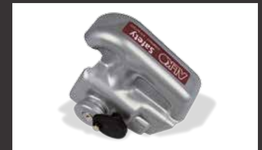
Diebstahlsicherung Safety Compact