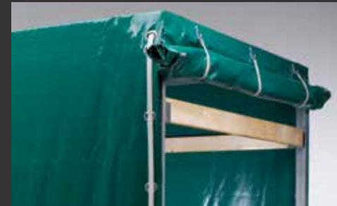
Plane & Spriegel, Ladehöhe mit 1300 mm / 1600 mm / 1800 mm / 2000 mm