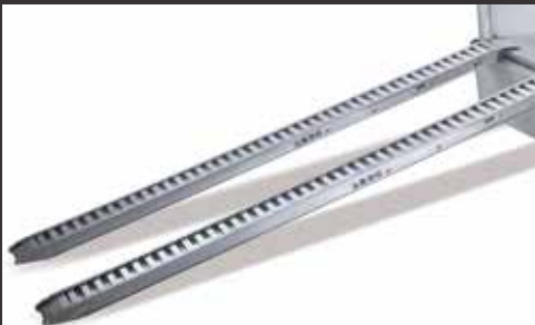
Aluminium-Bohlen (bis 1,9 t Tragkraft / Länge 2465 mm; bis 2,3 t Tragkraft / Länge 2230 mm; bis 2,8 t Tragkraft / Länge 2650 mm)