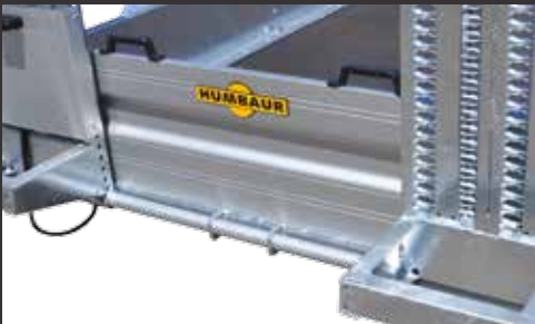
Alu-Steckwand (vor den Bohlen)