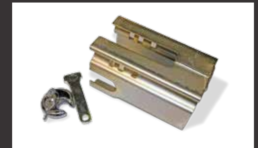
Metall-Absperrschuh mit Schloss