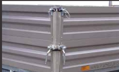
Bordwandaufsatz Stahl 350 mm