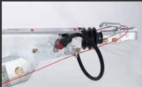
Kugelkopf-Kupplung für höhenverstellbare Deichsel