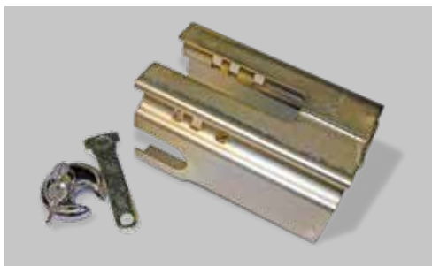
Metall-Absperrschuh mit Schloss