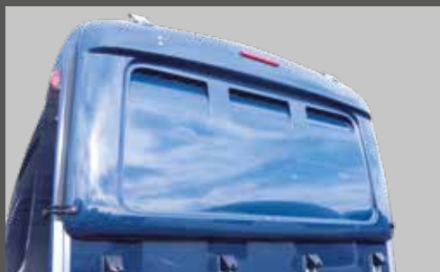
GFK-Windflap mit integrierter dritte Bremsleuchte (optional) für Balios®, Xanthos®, Zephir® und Maximus®