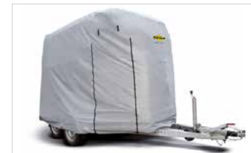
Schutzhaube für den kompletten Anhänger mit Reißverschlüssen für Türen und Auflaufklappe