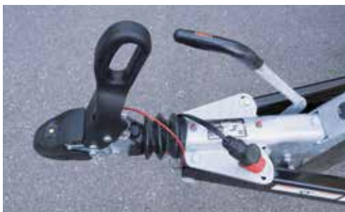
Sicherheitskupplung mit Spurstabilisierung