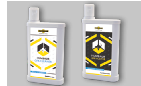
Spezieller GFK-Reiniger und GFK-Politur zum Werterhalt Ihres Voll-Poly Anhängers