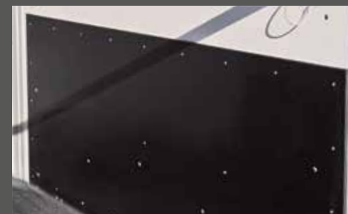
Seitentrittschutz (z.T. Serie)