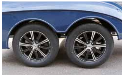
Zweifarbige Leichtmetallfelgen (silver/black) für einen exklusiven Look am Pferdeanhänger (z.T. Serie)