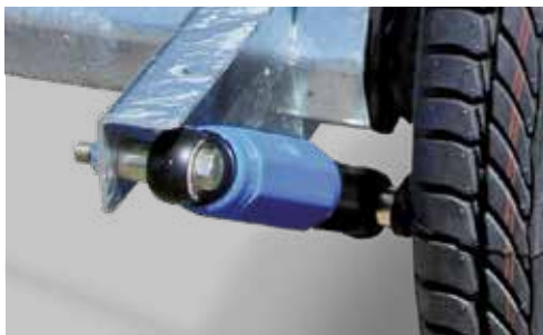
Radstoßdämpfer (z.T. Serie)