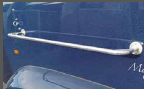
Sattelablagestange außen, feuerverzinkt