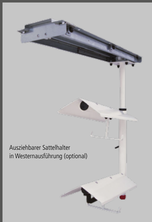
Ausziehbarer Sattelhalter in Westerausführung (optional)