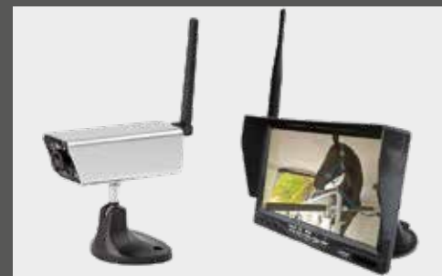
Funk-Kamera mit Monitor für Innenraum, auch verwendbar als Rückfahrkamera oder Ankuppelhilfe, mit Akku