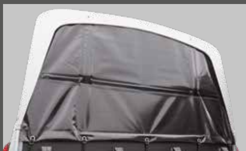
Planenrollo PVC (anstatt Windschott)