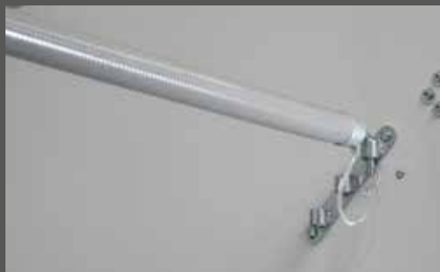
Durchgehende Boxenstange für den Fohlentransport (z.T. Serie)