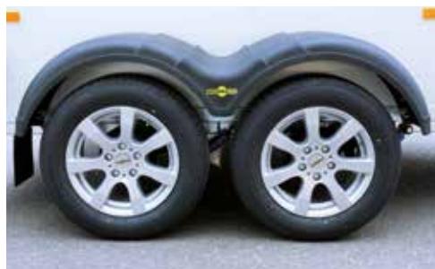
Leichtmetallfelgen für eine optische Aufwertung Ihres Pferdeanhängers (Design-Beispiel)